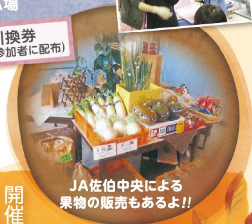
JA佐伯中央による 果物の販売もあるよ!!