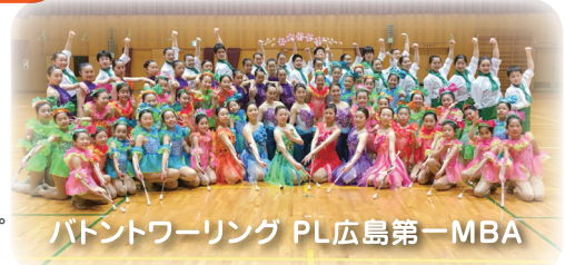
バトントワーリング PL広島第一MBA