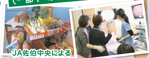
JA佐伯中央による 果物の販売もあるよ!!