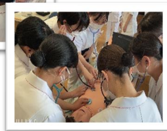
救急看護認定看護師によるフィジカルアセスメント研修の様子