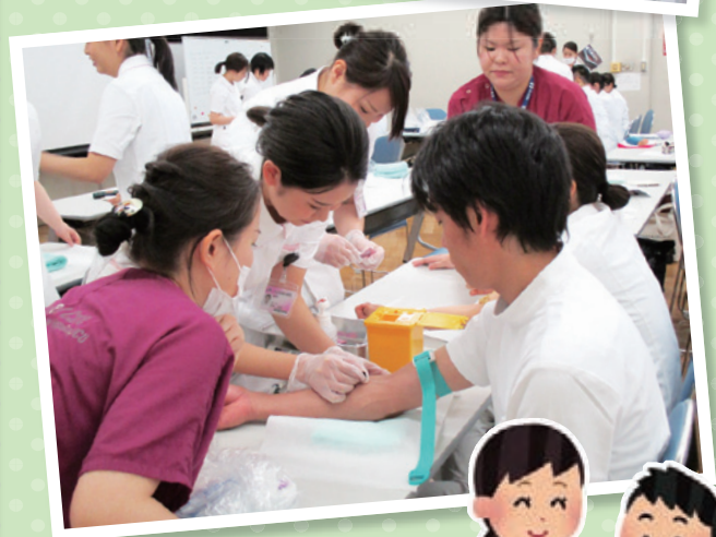
注射実技訓練の様子