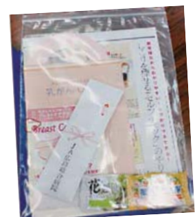
ささやかですが、お土産を。乳がん予防啓発のパンフレットと入浴剤です。