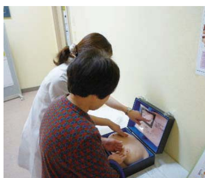
自己触診体験コーナーでの指導の様子