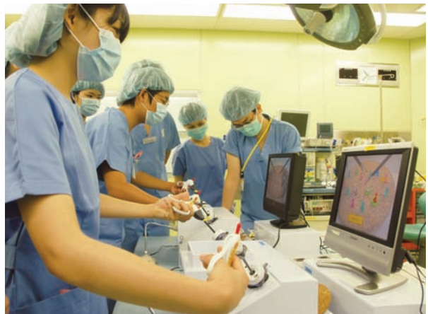
内視鏡外科手術トレーニング用エンドトレーナーでの鉗子操作体験

あたり、好評の内に無事終了しました。平日の通常業務中に開催できたことは患者さんや地域のご理解とご協力があればこそと深く感謝しております。また参加された高校生とご家族、各学校の先生方に深く感謝申し上げます。ありがとうございました。