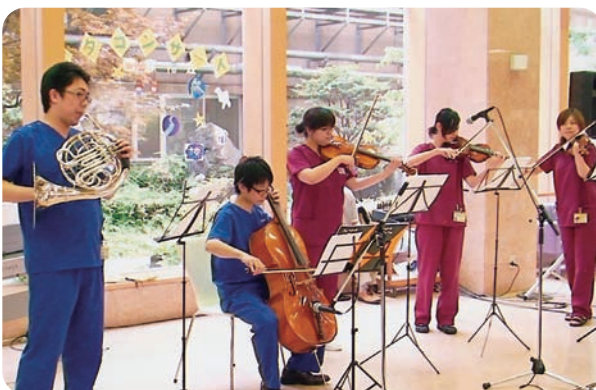
JA広島総合病院管弦楽団