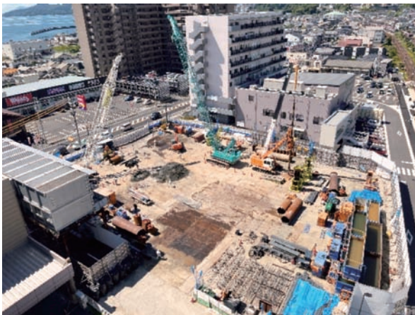
工事風景 (2022年7月末現在)